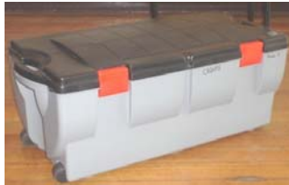
Maleta de traslado con ruedas