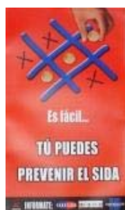
N°006 30 X 50,3 cm.

Afiches termolaminados producidos por el CRIAPS, CONASIDA, MINSAL, y otras organizaciones nacionales e internacionales, estos presentan un contenido que permite ser usado en el tiempo como elemento de apoyo educativo o informativo en la prevención del VIH/SIDA. Esta colección es posible prestarla a organizaciones o instituciones en calidad de exposición gráfica para actividades educativas. Aquí algunos afiches de la colección: