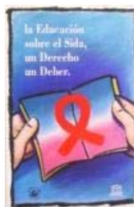
N°072 40 X 60 cm