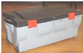
Maleta de traslado con ruedas