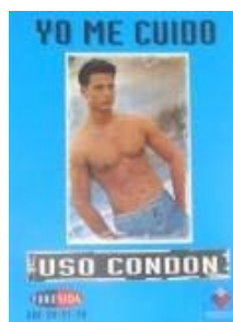
N°005 33 X 43 cm.