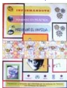
N°017 37,7 X 49,8 cm.