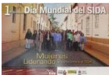
N°019 54 X 36 cm.