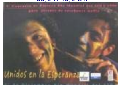
N°027 79,5 X 51 cm